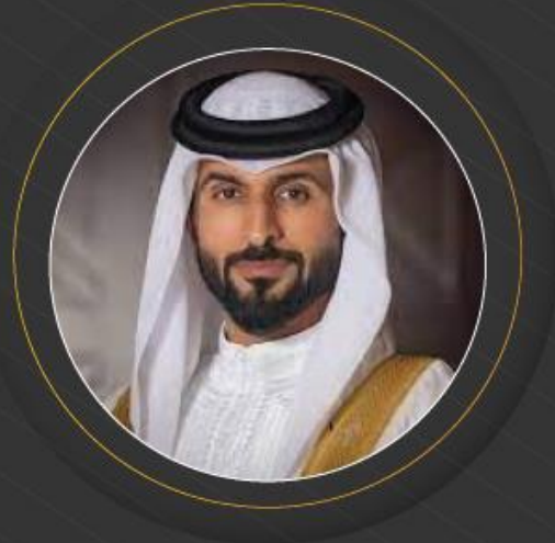
سمو الشيخ ناصر بن حمد بن عيسى آل خليفة

رئيس المجلس الأعلى للشباب والرياضة مملكة البحرين