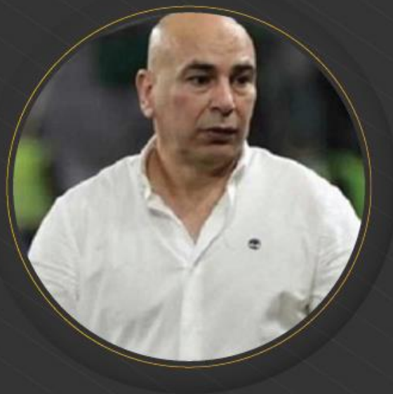
الكابتن حسام حسن المدير الفني لمنتخب مصر