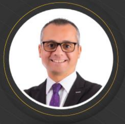
د عصام سراج الدين

مساعد وزير الشباب والرياضة للتسويق والاستثمار