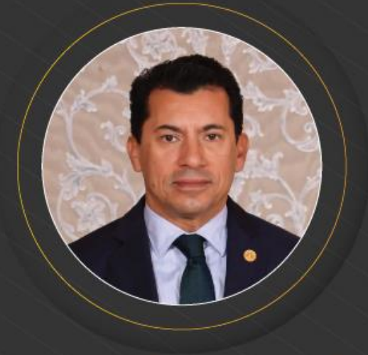
الأستاذ الدكتور أشرف صبحي

رئيس المجلس الأعلى للشباب والرياضة مملكة البحرين