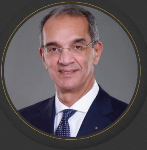
الدكتور عمرو طلعت وزير الاتصالات وتكنولوجيا المعلومات