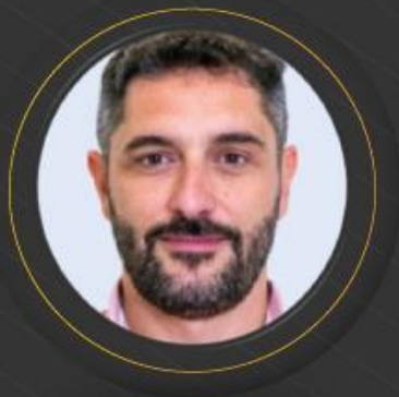
ألكس جيولو الرئيس التنفيذي لشركة ديكاثلون