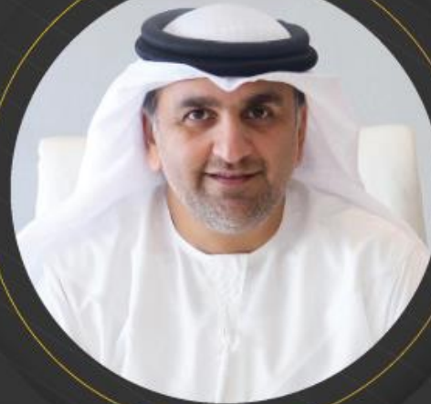
سعادة السيد عارف حمد العواني الأمين العام لمجلس أبو ظبي الرياضي دولة الامارات العربية المتحدة